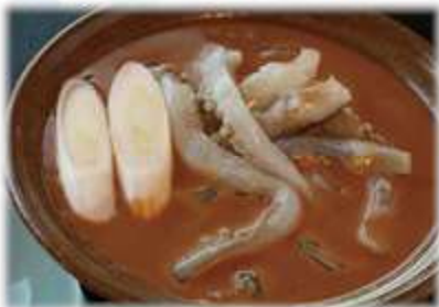
イカゲソのわた焼き