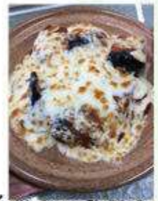
茄子のチーズ焼き