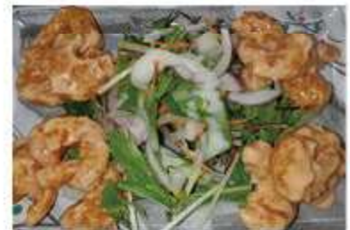
小エビのオーロラ和え